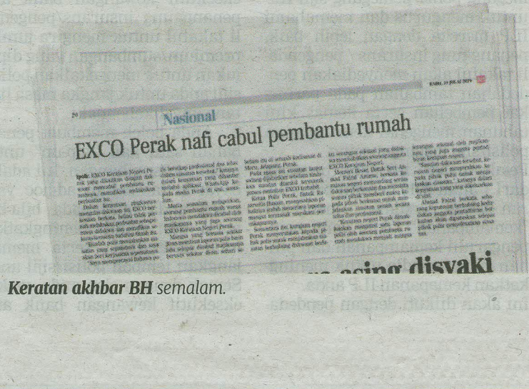
Keratan akhbar BH semalam.

Katanya, pada masa sama, beliau menghormati proses undang-undang yang sewajarnya dan mempercayai polis akan menjalankan siasatan secara profesional dan telus.