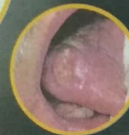
KANSER LIDAH DAN KANSER MULUT