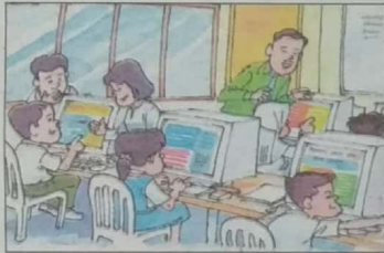
Meluaskan ilmu pengetahuan