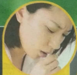
BATUK KRONIK DAN BATUK KERING

MEMBIMBING KE ARAH KEMAHIRAN BERFIKIR ARAS TINGGI (KBAT)