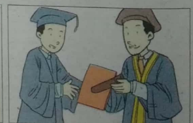
Peluang melanjutkan pelajaran