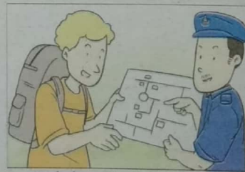
Berhubung dan berkomunikasi dengan orang lain