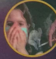
MENINGKATKAN RISIKO PEROKOK PASIF MENGHIDAP PENYAKIT KRONIK

Oleh Faizatul Farhana Farush Khan ffarhana@bh.com.my