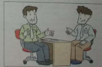
Peluang pekerjaan lebih baik