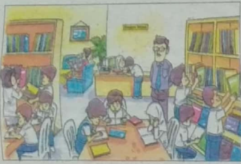
Memupuk minat membaca