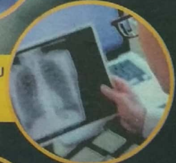
PENYAKIT PARU-PARU OBSTRUKTIF KRONIK (COPD)