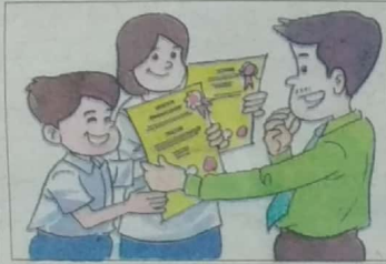
Memberikan pengiktirafan kepada pelajar