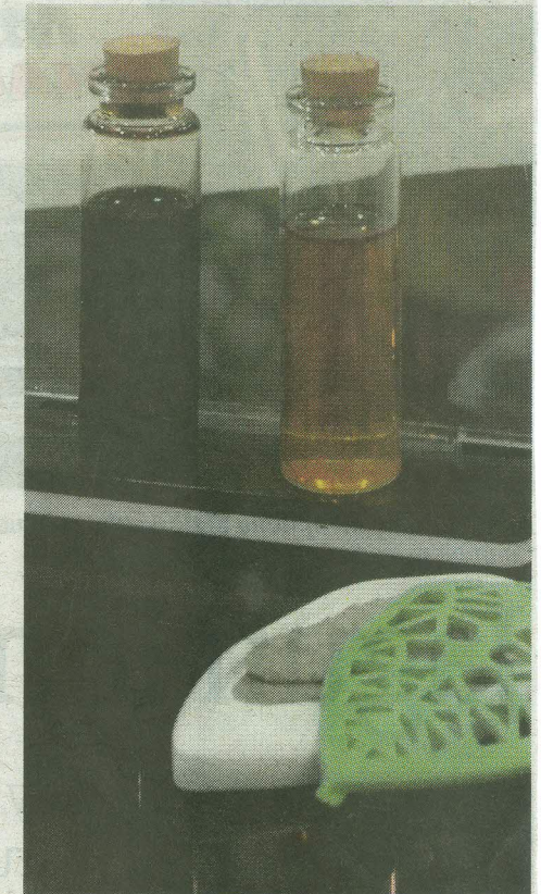
Produk ONOCAT mudah dibawa dan senang digunakan.

“Konsep reka bentuk ONOCAT mengambil inspirasi berdasarkan bentuk jaringan tisu nasal epitelium olfaktori kucing sebagai laluan keluarannya bauan secara optimum dengan cadangan warnanya bersifat glow in the dark sebagai tambah nilai berdasarkan mata kucing untuk melambangkan konsep kewaspadaan,” katanya.